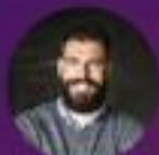
Donato Giovannelli professore ordinario di Microscopia presso l'Istituto Nazionale di Biostruttura e CNR-IRIBS